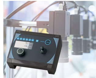
Kamera-Steuerung in der Produktion