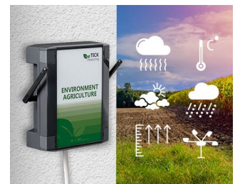
Wetterstation in der Landwirtschaft