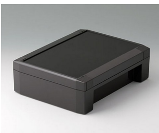
C8017221 SOLID-BOX 175 PC+ABS (UL 94 V-0) anthrazitgrau RAL 7016 225x175x70mm IP 66, IP 67, IK 08