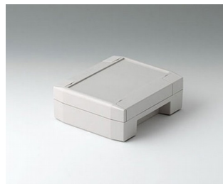
C8011132 SOLID-BOX 115 PC+ABS (UL 94 V-0) lichtgrau RAL 7035 135x115x50mm IP 66, IP 67, IK 08