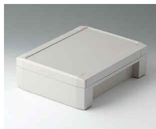
C8017222 SOLID-BOX 175 PC+ABS (UL 94 V-0) lichtgrau RAL 7035 225x175x70mm IP 66, IP 67, IK 08