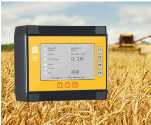
Datenerfassung für Erntemaschinen