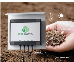
SMART FARMING - Messsystem für Langzeitmessungen