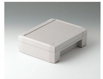
C8014182 SOLID-BOX 145 PC+ABS (UL 94 V-0) lichtgrau RAL 7035 180x145x60mm IP 66, IP 67, IK 08