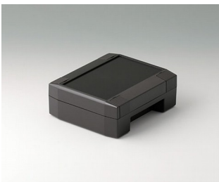
C8011131 SOLID-BOX 115 PC+ABS (UL 94 V-0) anthrazitgrau RAL 7016 135x115x50mm IP 66, IP 67, IK 08