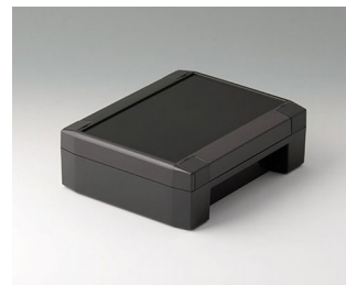
C8014181 SOLID-BOX 145 PC+ABS (UL 94 V-0) anthrazitgrau RAL 7016 180x145x60mm IP 66, IP 67, IK 08