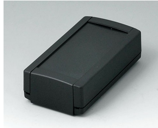
B1040369 TOPTEC 102, Ausf. I ABS (UL 94 HB) schwarz RAL 9005 102x54x30mm IP 40