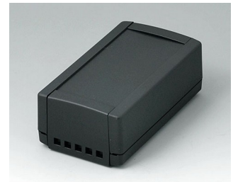
B1050469 TOPTEC 123 H, Ausf. II ABS (UL 94 HB) schwarz RAL 9005 123x68x45mm IP 40