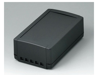
B1070469 TOPTEC 194 H, Ausf. II ABS (UL 94 HB) schwarz RAL 9005 194x115x68mm IP 40