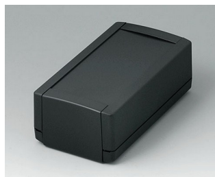
B1060369 TOPTEC 154 H, Ausf. I ABS (UL 94 HB) schwarz RAL 9005 154x84x56mm IP 40