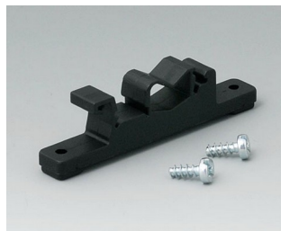
B1300019 Befestigungsteil für DIN- Schienen PA 6 schwarz RAL 9005