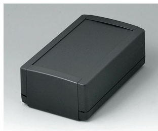
B1070369 TOPTEC 194 H, Ausf. I ABS (UL 94 HB) schwarz RAL 9005 194x115x68mm IP 40