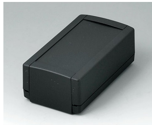
B1050369 TOPTEC 123 H, Ausf. I ABS (UL 94 HB) schwarz RAL 9005 123x68x45mm IP 40