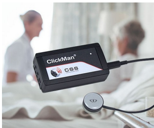
Adaptiver Multicontroller für Einfachsensoren