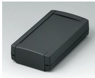
B1055369 TOPTEC 123 F, Ausf. I ABS (UL 94 HB) schwarz RAL 9005 123x68x30mm IP 40