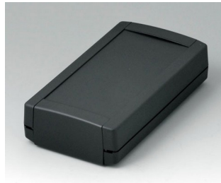
B1065369 TOPTEC 154 F, Ausf. I ABS (UL 94 HB) schwarz RAL 9005 154x84x38mm IP 40