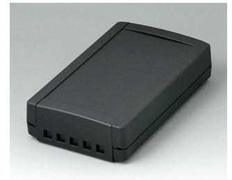
B1075469 TOPTEC 194 F, Ausf. II ABS (UL 94 HB) schwarz RAL 9005 194x115x46mm IP 40