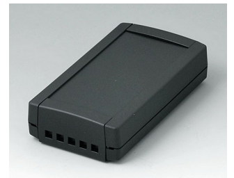
B1055469 TOPTEC 123 F, Ausf. II ABS (UL 94 HB) schwarz RAL 9005 123x68x30mm IP 40