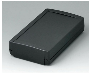
B1075369 TOPTEC 194 F, Ausf. I ABS (UL 94 HB) schwarz RAL 9005 194x115x46mm IP 40