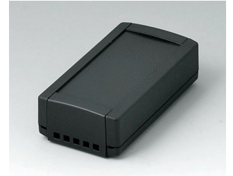
B1040469 TOPTEC 102, Ausf. II ABS (UL 94 HB) schwarz RAL 9005 102x54x30mm IP 40