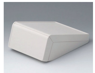
B4056137 UNITEC M, 0,6/1,4 ABS (UL 94 HB) grauweiß RAL 9002 148x210x80mm IP 40