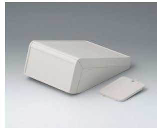
B4054227 UNITEC S, 1,4/0,6 ABS (UL 94 HB) grauweiß RAL 9002 125x177x69mm IP 40