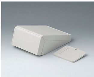
B4054307 UNITEC S, 0,6/0,6 ABS (UL 94 HB) grauweiß RAL 9002 125x177x69mm IP 40