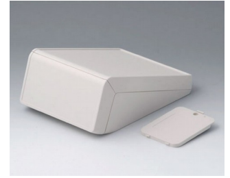
B4056237 UNITEC M, 0,6/1,4 ABS (UL 94 HB) grauweiß RAL 9002 148x210x80mm IP 40