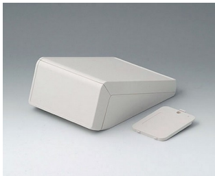
B4054207 UNITEC S, 0,6/0,6 ABS (UL 94 HB) grauweiß RAL 9002 125x177x69mm IP 40