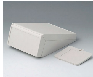
B4056327 UNITEC M, 1,4/0,6 ABS (UL 94 HB) grauweiß RAL 9002 148x210x80mm IP 40