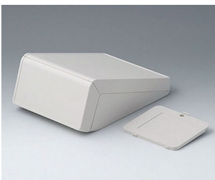
B4056307 UNITEC M, 0,6/0,6 ABS (UL 94 HB) grauweiß RAL 9002 148x210x80mm IP 40