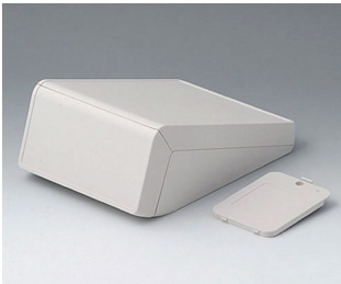
B4056207 UNITEC M, 0,6/0,6 ABS (UL 94 HB) grauweiß RAL 9002 148x210x80mm IP 40