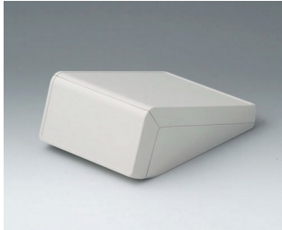
B4054107 UNITEC S, 0,6/0,6 ABS (UL 94 HB) grauweiß RAL 9002 125x177x69mm IP 40