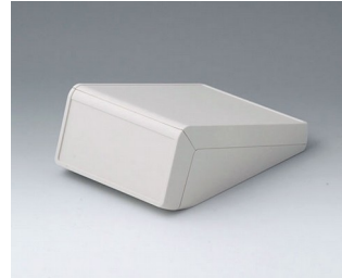
B4054127 UNITEC S, 1,4/0,6 ABS (UL 94 HB) grauweiß RAL 9002 125x177x69mm IP 40