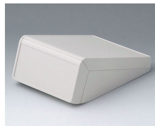
B4056127 UNITEC M, 1,4/0,6 ABS (UL 94 HB) grauweiß RAL 9002 148x210x80mm IP 40